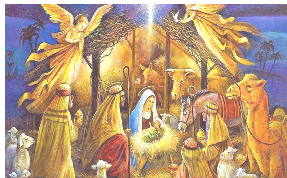
[Epiphany of the Lord]

Dear Jesus, as You led the Magi to You by the light of a star, please draw us ever closer to You by the light of Faith. Help us to desire You as ardently as they did. Give us the grace to overcome all the obstacles that keep us far from You. May we, like them, have something to give You when we appear before You. Mary, Our Mother, help us to know Your Son. Amen.